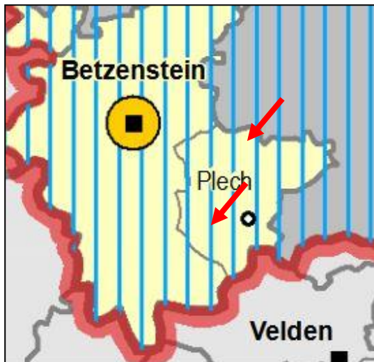
Abb. 1: Ausschnitt RP Oberfranken-Ost – Karte 1: Raumstruktur

Hinsichtlich Erneuerbarer Energien ist es Ziel des Regionalplanes, dass auf die verstärkte Erschließung und Nutzung erneuerbarer Energiequellen in allen Teilräumen der Region hingewirkt werden soll. Dies gilt insbesondere bei Berücksichtigung der Umwelt- und Landschaftsverträglichkeit für die wirtschaftliche Nutzung von Wasserkraft, Windenergie, Solarenergie sowie sonstigen erneuerbaren Energien und nachwachsenden Rohstoffen (B.X.5.1).