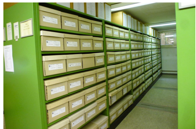
Archivierte Unterlagen im Archiv der Stadt Auerbach

Aktuell sind die beteiligten Gemeinden auf der Suche nach einem Archivar (m/w/d). Die Stellenausschreibung ist auf der Internetseite der Gemeinde Hartenstein zu finden. Bewerbungsfrist ist am Freitag, 29.04.2022.