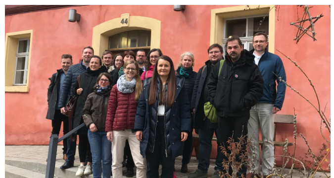
Die Gruppe vor dem Maassenhaus in Betzenstein

Das nächste Treffen soll in der ILE Vorderer Bayerischer Wald durchgeführt werden.