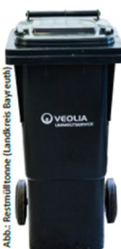
Abb.: Restmülltonne (Landkreis Bayreuth)

Bitte die Asche oder abgekühlte Holzkohle in Müllbeutel füllen, damit sich bei der Leerung der Tonne kein Staub bildet.