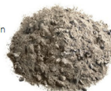
Abb.: Asche